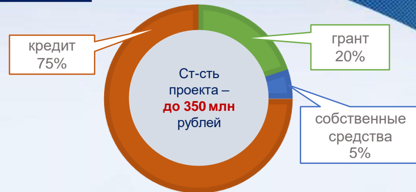
схема финансирования стоимости проекта, реализуемого с участием льготного инвестиционного кредита