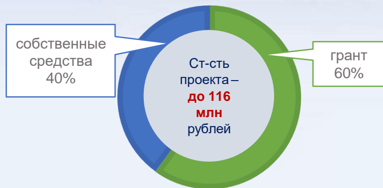
«классическая» схема финансирования стоимости проекта

70 млн рублей – на приобретение производственных объектов, оборудования, спецтехники и транспорта, мощностей для хранения продукции, торговых объектов