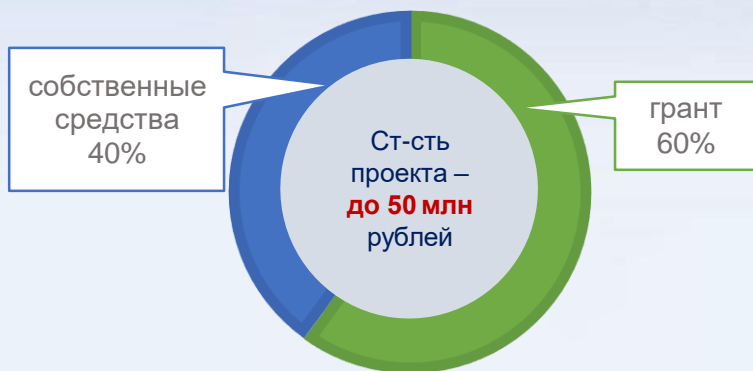
«классическая» схема финансирования стоимости проекта

30 млн рублей – на все виды деятельности